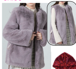
チェンジャブル エコファー