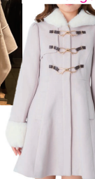
ファー装飾 ビットダブル