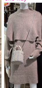
トップス レイヤード ニットOP