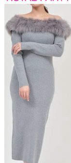
ファー装飾 オフショル ニットOP