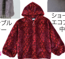
バイソン柄 エコファーJK