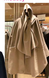
共布 ストール ケープ コート