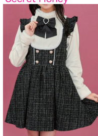
ファー装飾 ファンシーツイード ジャンスカ