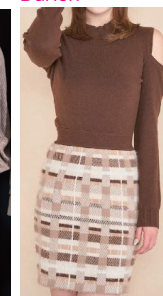
肩見せ コーディネート ニットOP