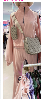
ハーフジップ ベロア調トラック セットアップ