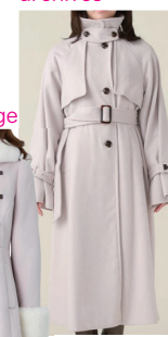
ハイネック ウール トレンチ