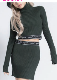
お腹見せ ロゴテープアクセント ニットセットアップ