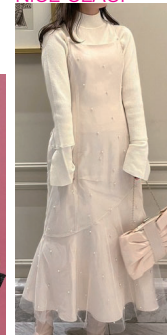
パール装飾 チュールレイヤード キャミOP